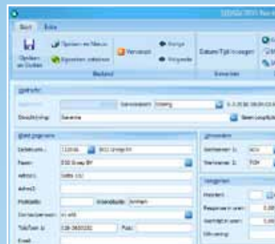
Snelle registratie van storingen of ad hoc werkzaamheden

Daarnaast biedt de module Management Assistent de nodige extra, proactieve functionaliteit voor het nog slagvaardiger kunnen opereren van de organisatie als geheel. Evenals de andere modules binnen UNIT4 Multivers kent ook UNIT4 Multivers Service Manager een verregaande integratie met de Microsoft Office omgeving.