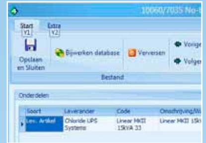
Onderdelen per installatie tot in detail vast te leggen

De servicemonteur kan op locatie interactief communiceren met het UNIT4 Multivers backoffice systeem. Dit gaat via een mobiel apparaat voorzien van Windows Mobile, waarop een voor dit doel ontwikkeld programma draait. Dit speciaal voor monteurs ontwikkelde programma werkt op basis van een draadloze internetverbinding en communiceert rechtstreeks met UNIT4 Multivers Service Manager. Hierdoor is de buitendienstmedewerker in staat om steeds direct alle actuele uit te voeren werkopdrachten in te zien.