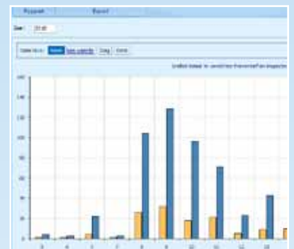
Benodigde capaciteit per periode inzichtelijk